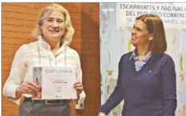
Hortensia Arte Floreal, ganador del Concurso de Escaparatismo