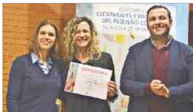
Tamara Machón Fotografía, ganadora del concurso de Webs

suponen un reconocimiento, un impulso y un respaldo para el conjunto del tejido comercial de la ciudad”, señaló la alcaldesa, que agradeció de manera especial su esfuerzo por “animar y embellecer las calles, avenidas y plazas de nuestros barrios, especialmente en estas fechas navideñas”. La edil de Comercio, por su parte, destacó que “se ha buscado la originalidad, la creatividad y el mejor gusto en la decoración de los escaparates, y el diseño, la funcionalidad y la seguridad en los sitios web presentados al concurso. Y los jurados no lo han tenido fácil, como prueba el hecho de que se han concedido un total de diez accésits en el apartado de escaparatismo”. Mientras, Antonio Saldaña indicó que “el diseño de un escaparate es importante,