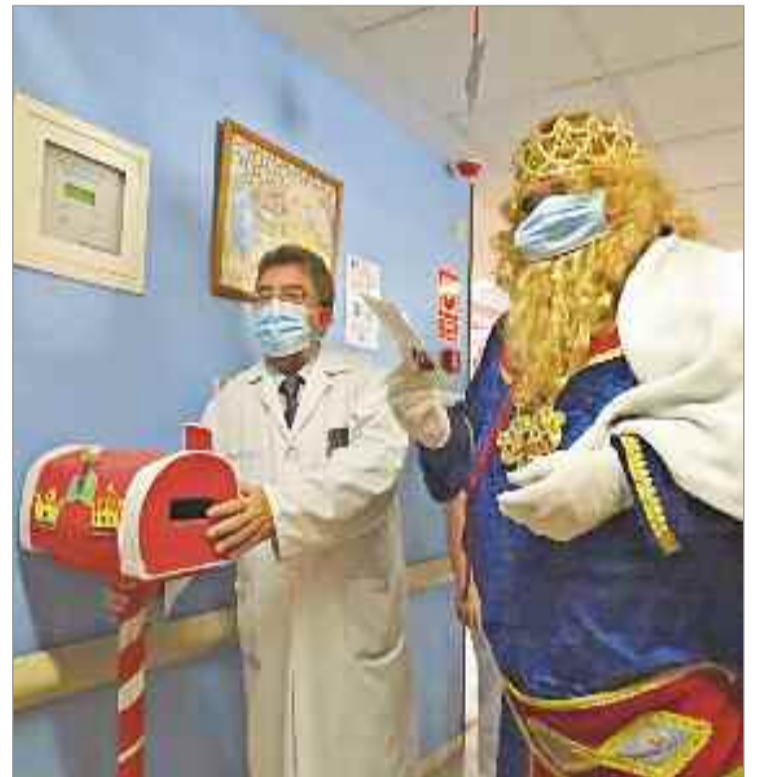
Sus Majestades Los Reyes Magos recogieron las cartas del 'Buzón Real' del Hospital, y llenaron de ilusión y regalos a los más pequeños