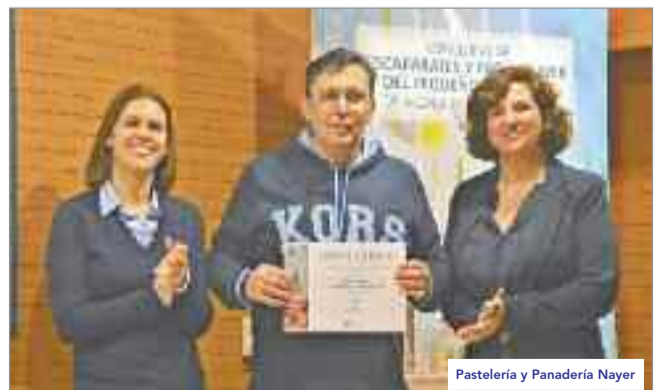
Pastelería y Panadería Nayer