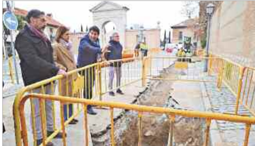
El recinto amurallado es el vestigio más importante que ha llegado hasta nuestros días de la Alcalá

conocimiento sobre la trama urbana de la ciudad medieval, el importante papel defensivo de la puerta de Madrid y la potencia de las defensas organizadas por Pedro Tenorio en el turbulento Siglo XIV para proteger el Palacio Arzobispal". En concreto, se ha localizado una base de arcillas de color rojizo amarillento, la cimentación y parte del alzado, incluso con los revocos, que pertenecen al viejo lienzo mandado construir en las últimas décadas del siglo XIV para reforzar las defensas del palacio de los arzobispos de Toledo, señores de Alcalá y su tierra. La parte de lienzo hallada ahora