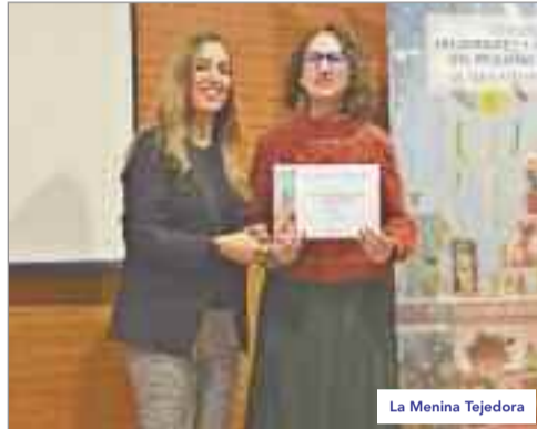
La Menina Tejedora