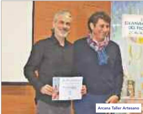
Arcana Taller Artesano