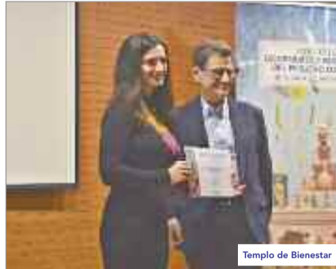
Templo de Bienestar