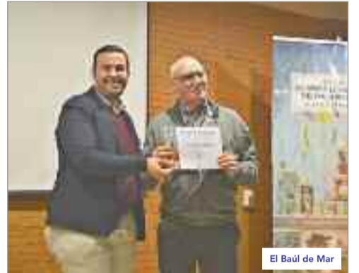
El Baúl de Mar