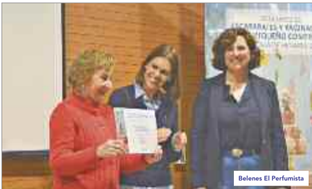
Belenes El Perfumista