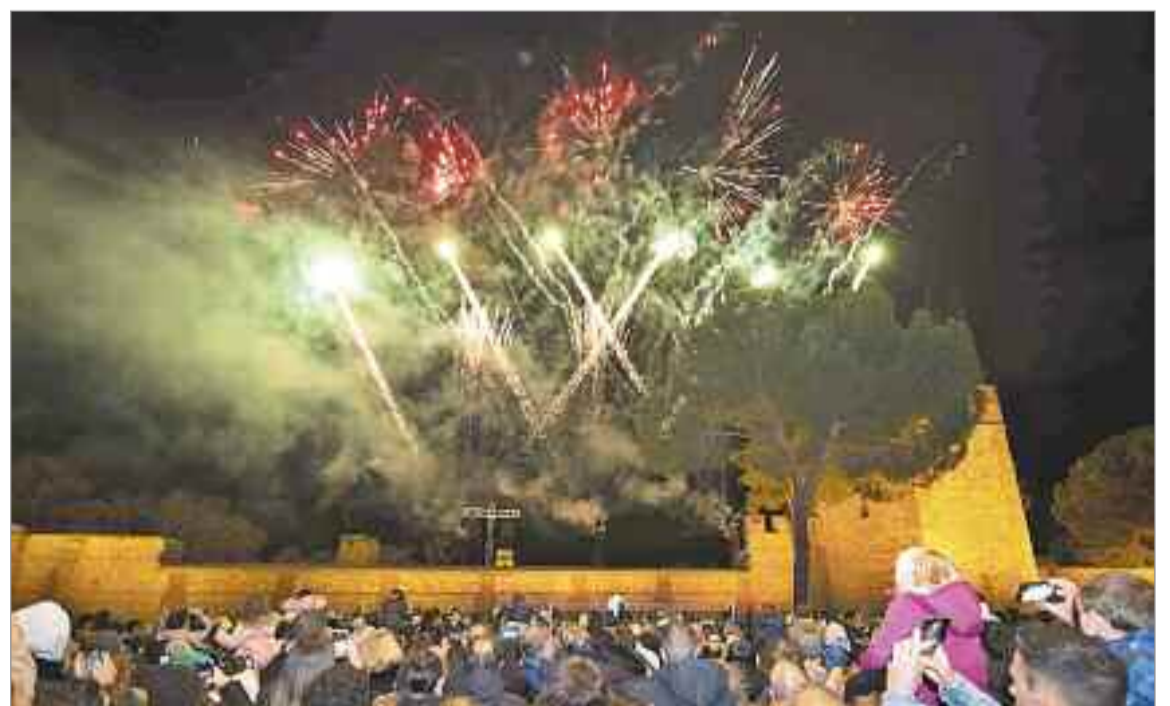
El final de la cabalgata fue una de las grandes novedades de esta edición, con un espectáculo piromusical que hizo las delicias de todos.