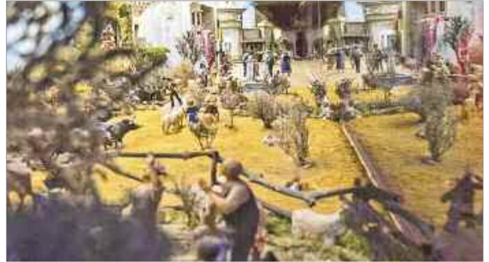
El Belén Tradicional de la Casa de la Entrevista, de unos 35 metros cuadrados a cuatro caras vistas, dispuso de unas 70 figuras de entre 30 a 24 centímetros, totalmente renovado

Mientras, el Belén Tradicional de la Casa de la Entrevista , de unos 35 metros cuadrados a cuatro caras vistas, dispuso de unas 70 figuras de entre 30 a 24 centímetros, totalmente renovado y con iluminación LED escenificada, y contó con escenas inéditas y muy originales, entre ellas una espectacular caravana de los Reyes Magos y una Natividad de gran dulzura. El concejal de Fiestas y Tradiciones Populares, Antonio Saldaña, quiso agradecer "el gran trabajo de la Asociación Complutense de Belenistas, que un año más volvió a llenar de magia y hacer más grande la Navidad alcalaína, un gran trabajo que realizan durante todo el año y que durante la Navidad tenemos la oportunidad de disfrutar" .