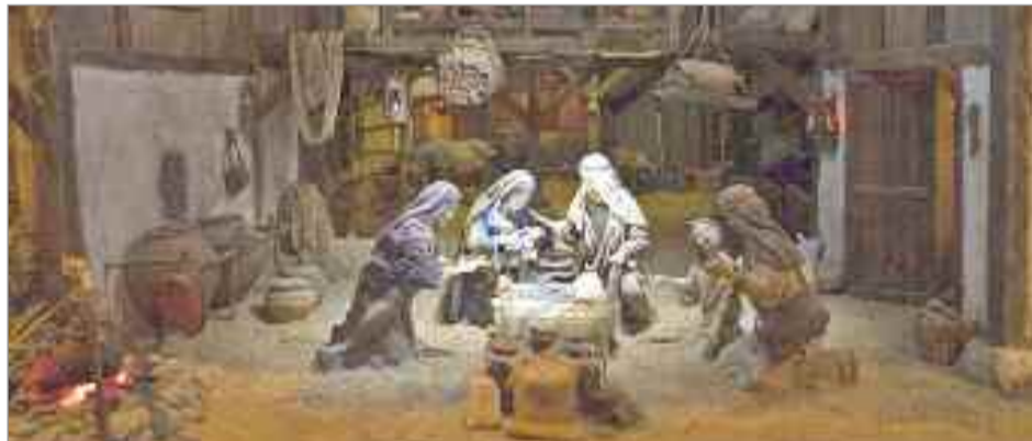
El Gran Belén Monumental, estuvo ambientado en la aldea de Belén justo en el momento del nacimiento de Jesucristo, con la Sagrada Familia en un gran establo de madera,

El Gran Belén Monumental , estuvo ambientado en la aldea de Belén justo en el momento del nacimiento de Jesucristo, con la Sagrada Familia en un gran establo de madera, la caravana de los Reyes Magos acercándose desde el horizonte, las actividades artesanales de la aldea y la anunciación del Ángel a los pastores, entre otras escenas originales, como la escuela o el empadronamiento y un pequeño guiño a nuestra ciudad que los organizadores confían en que sea descubierto por nuestro público.