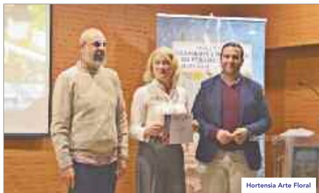
Hortensia Arte Floral